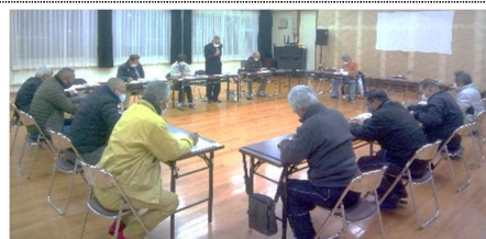
帝釈版地域包括 ケアシステム

地域包括ケアネット連絡会については、住民の皆様の理解を深めていただくため、ケアネットの利用方法や住民の見守りについて、サロンや支部の会合などに事務局が出かけて説明させていただきますので開催日時をご連絡ください。