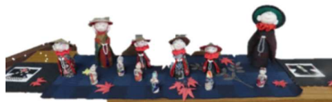
コロナ地蔵 コロナ退散