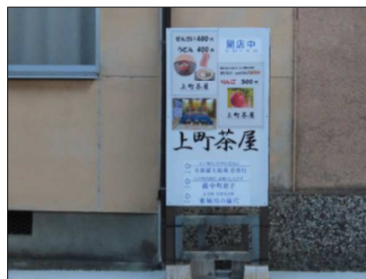
通りには手作り看板を立てアピール