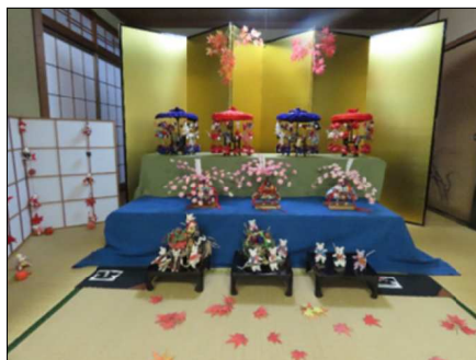
手芸教室等製作 力作の人形