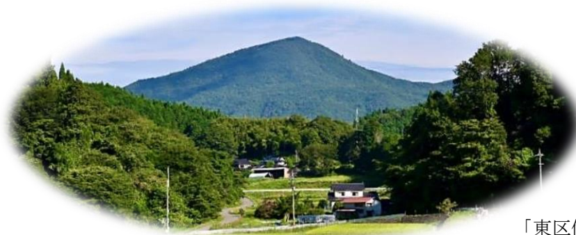
「東区伊瀬から眺める多飯が辻山」

空き家問題、Uターンの相談などは上記の定住推進員、または振興区までお知らせください。