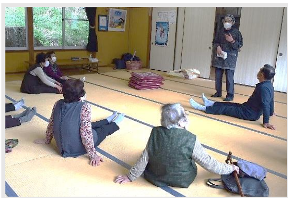
デイホームなごみ

5月にはデイホームあさくら、6月からはデイホーム北桜会も開催を予定しています。これまで通り感染症予防に努めながら、皆さんと健康づくりを進めていきたいと思っておりますので、よろしくお願いいたします。