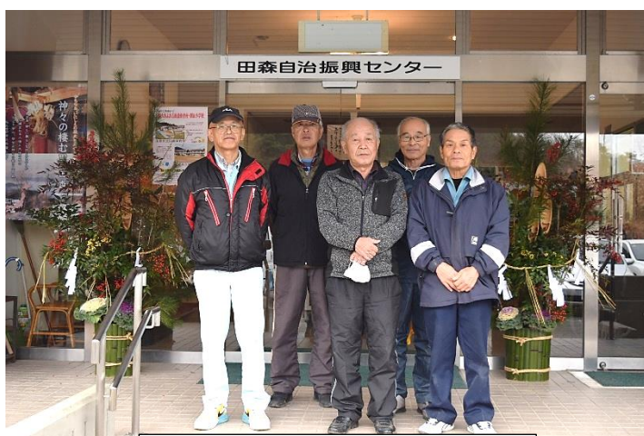
門松を設置していただきました

さて、令和三年は多事多難の年でありました。早期にコロナの終息を迎え、人々に安心をもたらすことが求められています。住民の皆さんや関係機関の努力により、一人の感染者も出すことなく新年を迎えられたことは、最も私の喜びとするところであります。しかし一方で、多くの予定した事業が中止せざるを得ない状況下であり、一人一人の意欲を失わせた一面もあります。このまま沈んでしまったのでは、地域の未来は開かれません。新しい知恵を出し、賢明なる判断をし、前進する年となる様願うものであります。