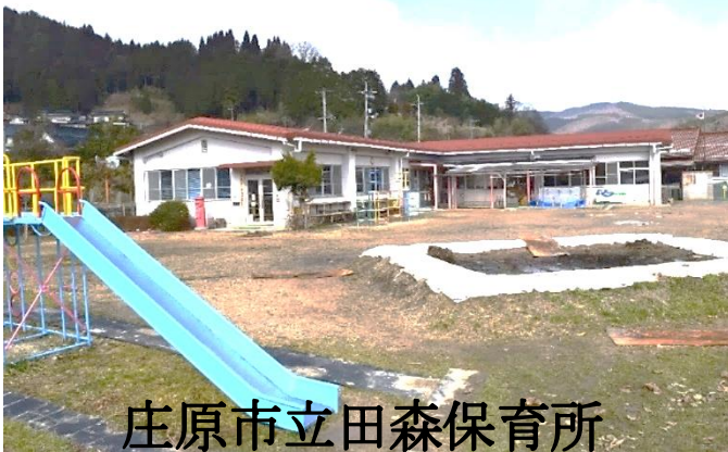
庄原市立田森保育所

小規模校のメリットを最大限に生かし、「自ら考え」「判断・行動し」共に伸びる学校を目標に頑張っています。