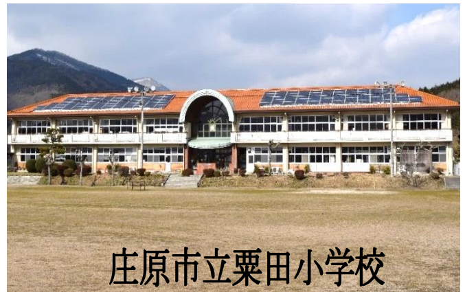
庄原市立栗田小学校