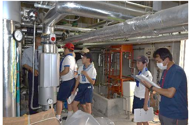
昨年の高学年「地域学習」の様子

郷土の歴史や産業など、学年の学習内容に応じて学ぶことができるよう支援してまいります。