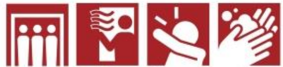
密閉回避 換気 咳エチケット 手洗い