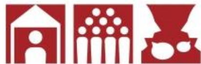
外出控え 密集回避 密接回避