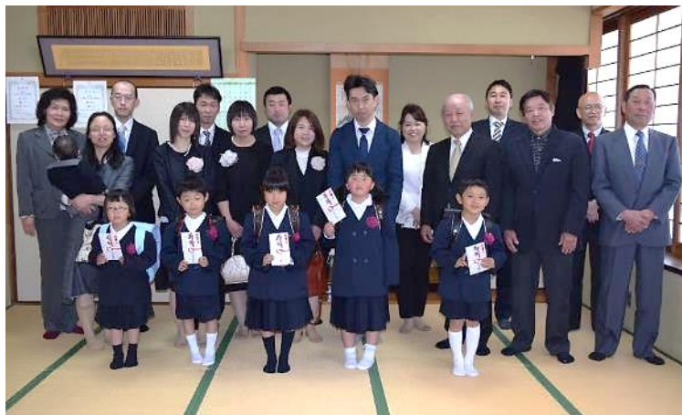
昨年のランドセル賞

栗田小学校は、少人数学級ですが、一人ひとりに目が行き届き、個に応じたきめ細やかな指導が行われ、基本的な生活習慣の確立、基礎・基本の学力の向上を図っています。また、恵まれた環境のもとで自然に触れ、地域との交流など社会性も育まれています。