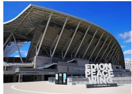
エディオンピースウイング広島

広島市内の新たな賑わいや観光のスポットになった両施設の魅力がどんなものか、体感してみましょう。