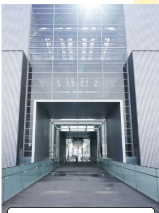
広島市環境局中工場