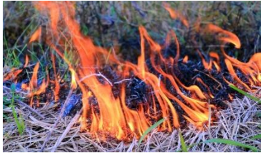
(野焼きのイメージ写真)