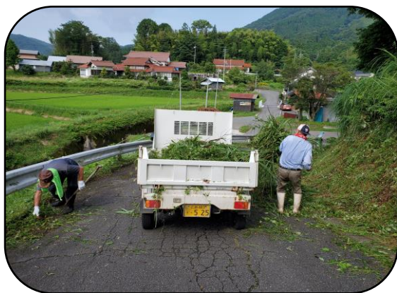
進入路がきれいになりました

環境整備の後、飯山会の皆さんには健康寿命向上セミナーを受講していただきました。高齢になるにつれて、心身の衰えはないかチェックすることや健康体操を指導していただきました。飯山会の皆さんは60代~70代の会員で構成されていますから、皆さんまだまだ元気で活躍されている方ばかりです。今回のセミナーは、草刈り作業後のストレッチ体操も兼ねていたので、身体のアフターケアになりました。普段の農作業後にも取り入れてみてはいかがでしょうか。