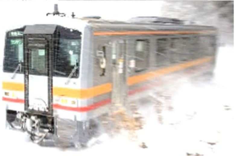
冬の芸備線 キハ120・小奴可にて

こちらのロングコースは高校生以上が対象の本格派。14,000 円の参加費には、保険料、エイドステーションでの飲食代、記念品代などを含むそうです。小奴可駅のエイドステーション(食べ物、飲み物の補給所)は小奴可自治会、加谷自治会のみなさんが、当地域の自慢の食材で約100名のランナーに万全の態勢です。地図の右上、A6の地点です。先頭通過が11時くらいなので、加谷、内堀、塩原は、それぞれもっと早くなりますよ。小奴可、加谷、内堀、塩原、千鳥、小串のみなさん、ぜひ、応援しましょう。その次は、「林家ひろ木落語会」にどうぞ!