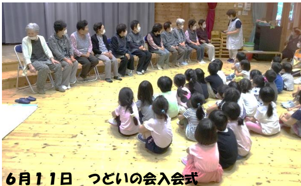
6月11日 つどいの会入会式