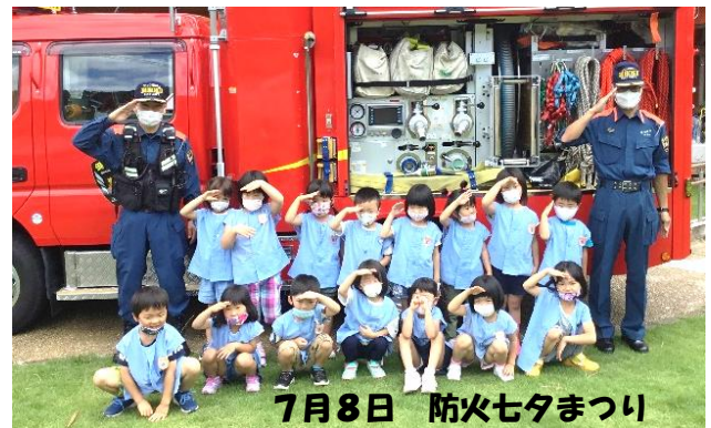
7月8日 防火七夕まつり

6月に自粛要請が解除され、6月11日に毎月2回地域のみなさんと交流する「つどいの会」の入会式、7月8日には、「防火七夕まつり」を行いました。