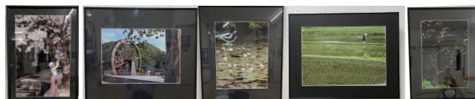
▲庄原市西城市民病院に展示中の作品。八銚メンバーは5名、毎回多彩な作品が揃います。

写真クラブは写真の撮影方法を学んで撮影技術を向上させることを主な目的として活動しています。活動内容は各自で持ち寄った写真スクリーンに映しての鑑賞会、年2回程度ウイル西城や西城支所への展示、春と秋に西城の写友会と合同で撮影会に出かけています。