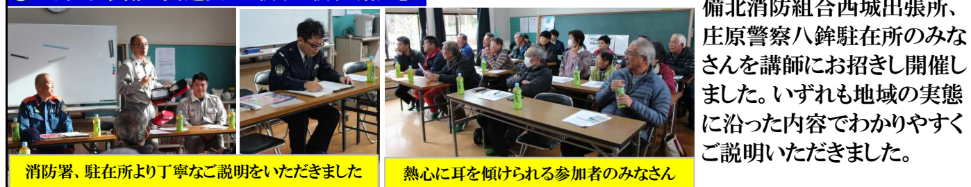
消防署、駐在所より丁寧なご説明をいただきました