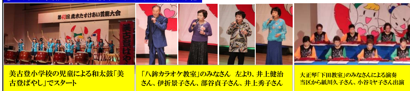
美古登小学校の児童による和太鼓「美古登ばやし」でスタート

①12月1日開催「第43回歳末たすけあい芸能大会」 ※樽募金に214,666円ご協力いただきました。