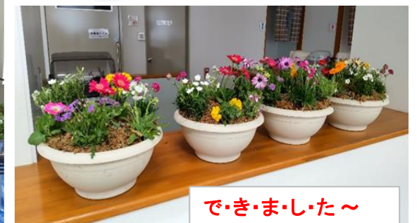
で・き・ま・し・た～