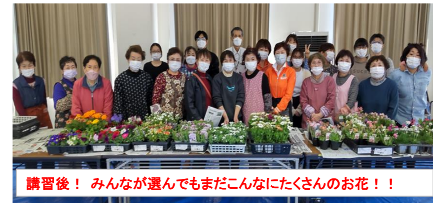
講習後! みんなが選んでもまだこんなにたくさんのお花!!