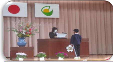
西城小学校 3月24日(木)