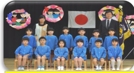
西城保育所 3月19日(土)