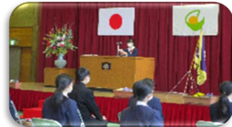
西城中学校 3月10日(木)