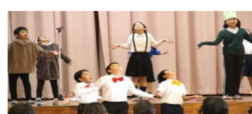
2年生「名前を見てちょうだい」 あつい！トウモロコシを知ろう～