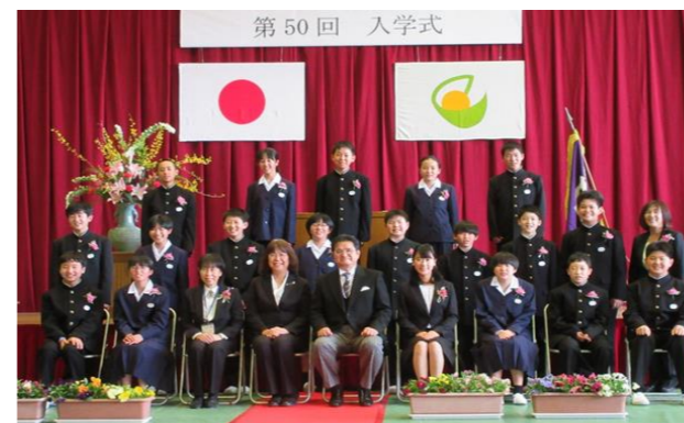
新入生、みんな良い笑顔ですね

西城中学校では、4月7日(水)の午後に令和3年度入学式を挙行されました。式辞に続き校長先生から大切な3つのことが新入生にはなされました。それは