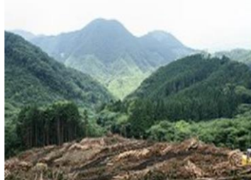
今櫛山 旧名は「朝日山」