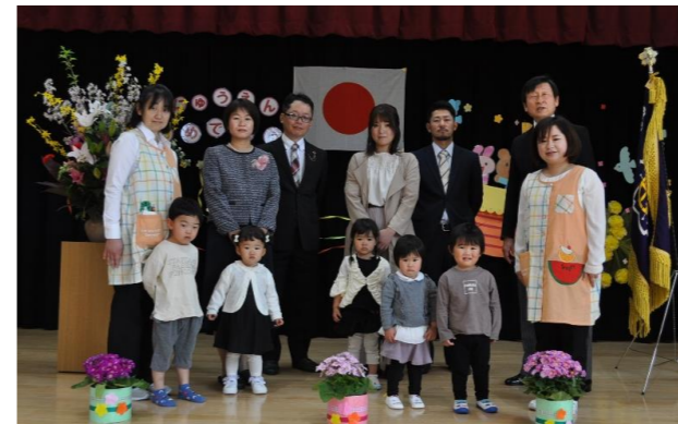
ひよこ2組の集合写真、少し緊張したかな