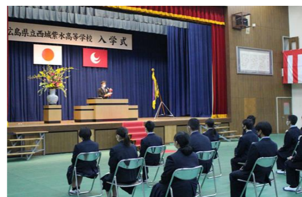
校長先生の式辞をしっかりと聞いている新入生

広島県立西城紫水高等学校では、3月1日(月)に令和3年度入学式が挙行されました。