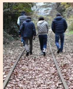
廃線トレッキング