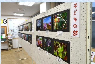
西城自治振興センター（下） 県民の森1階廊下（上）

「西城の四季」をテーマにフォトコンテストを開催し、104点の作品応募がありました。現在、西城自治振興センターと県民の森の1階廊下に展示してあります。展示替えをしながら全作品を展示しますので、ぜひご覧ください！！