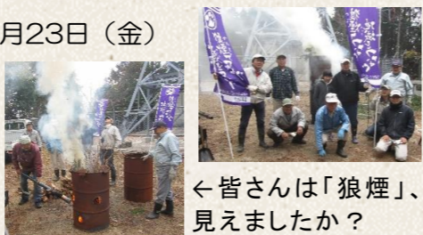
←皆さんは「狼煙」、見えましたか？

平子自治会では、本年も地域をつなぐ狼煙再現に取り組まれました。市内10か所から狼煙が上がりました。西城町は高地区から本村地区へとリレーする中間地点にあたり、昨年と同様に四天蓋（皆さんもご存じ、「テレビ塔」）から狼煙を上げられました。西城大橋など町内各所から白い煙がよく見えました。