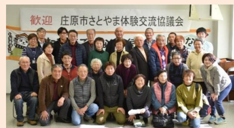
民泊を通じて色々な交流ができました！

庄原市さとやま体験交流協議会が開催する民泊の研修会に参加し、鳥取県倉吉地区に行ってきました。参加者は、協議会の事務局と庄原市の受入家庭（西城・比和・高野から19名）で、倉吉地区の受入家庭5軒に分かれ「そば打ち体験（共同調理）」「散策」「野菜の収穫」などを体験しました。普段、私たちは受入側ですが、今回は泊まる側で、（来られる生徒の気持ちになって）実際に宿泊体験を行いました。参加者からは、「この研修で、子どもたちの不安な気持ちや、受入家庭さんとの交流の楽しさを身をもって経験できて良かった。」という感想がありました。1泊2日の研修でしたが、意見交換やお互いの地域のことを知る良い機会になりました。