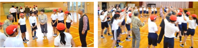
えらい児童も「えんじゅく」といって、お話を聞かせてくれました。みんなが楽しそうに聞いていました。

参加者からは「踊りは難しかったけど、児童の皆さんは教えるのが上手でした」「授業の様子を見る機会がないので、面白かった」といった感想がありました。