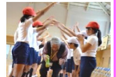
アーチでお見送りありがとうございました♪