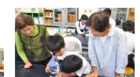
肩叩きのサプライズ皆さん気持ちよさそう☆