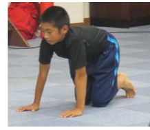
このポーズで背骨を伸ばすことができます。

みなさんは、手が後ろに届きますか？ 毎日のトレーニングを続けることで、肩甲骨が柔らかくなります！