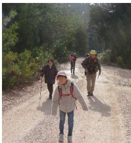
頑張って歩きました(1.6km)