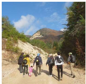
中央奥が狼煙上げ場所