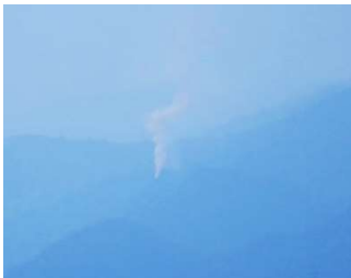
山内自治振興区(甲山城址)