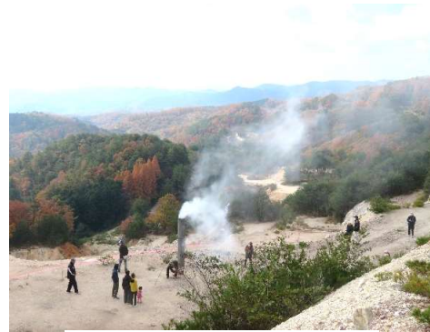
「狼煙」上げ場所の様子