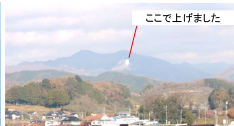
北自治振興区(勝光山)