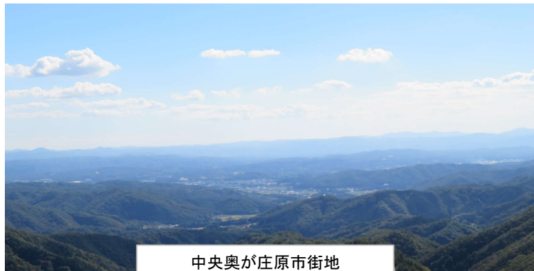
中央奥が庄原市街地