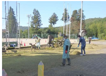
昨年度の様子です