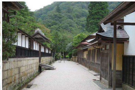
櫻井家住宅（映画のロケにも使われています）