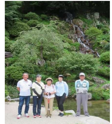
櫻井家日本庭園「岩浪の庭」

次に、日本遺産「たたら角炉伝承館」～旧楨原製鉄場角炉～を見学し帰路につきました。