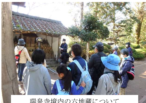
瑞泉寺境内の六地藏について