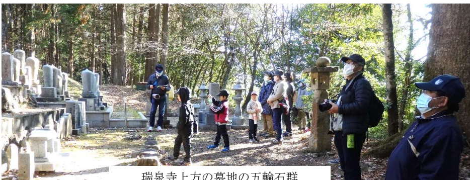
瑞泉寺上方の墓地の五輪石群