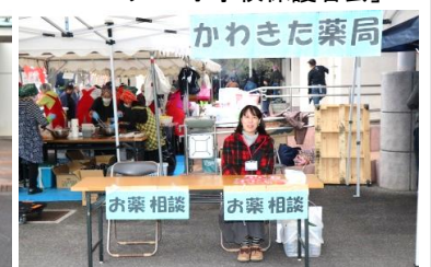
相談コーナー「川北薬局」