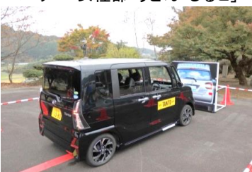
「サポートカー乗車体験」