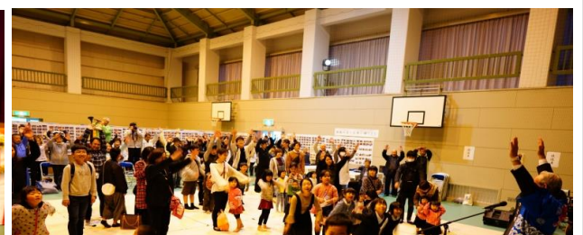
「閉会式・万歳三唱」