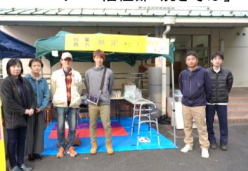
相談コーナー「庄原同仁病院」