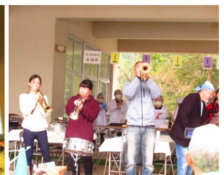
「川北小学校保護者」