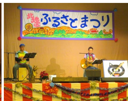
「Japan pop music★SIN★」