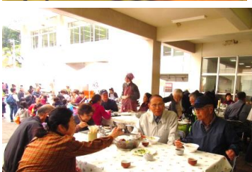
バザー「女性部・うどん・しるこ」