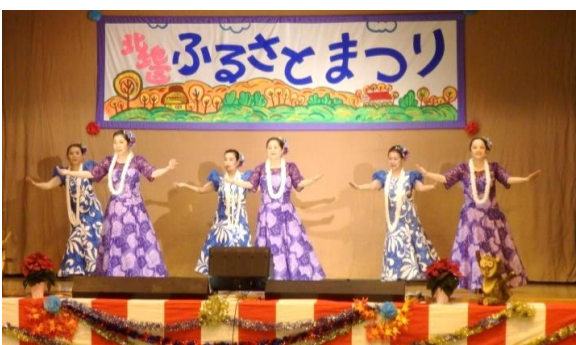
フラダンス「モアナフラ ロケラニ」