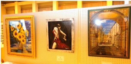
「作品展示コーナー」