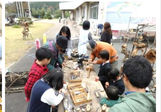
のんき工房コーナー