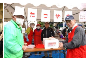
バザー「年輪の会・たこやき」