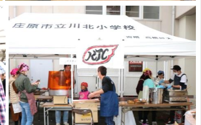
バザー「小学校保護者会」