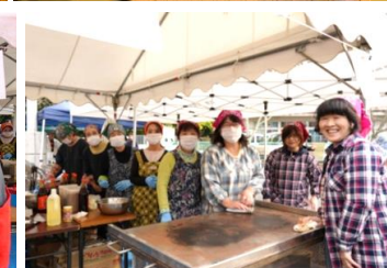
バザー「福祉部・焼きそば」