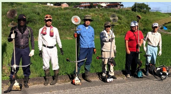
↑水越町 県道平和金田線チームのみなさんです