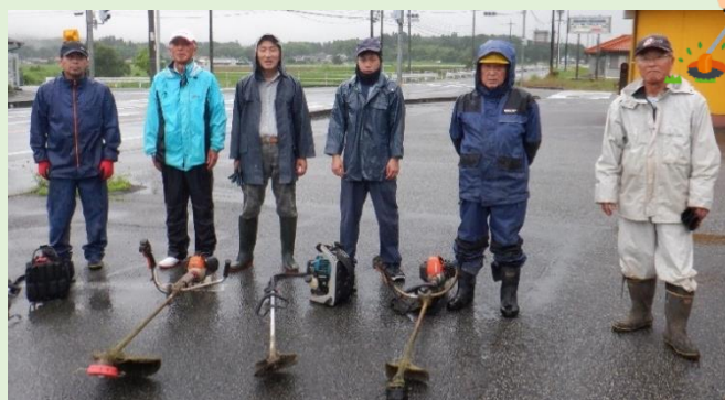
↑平和町 国道183号線チームのみなさんです