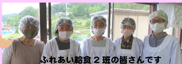
ふれあい給食2班の皆さんです

ふれあい給食は、在宅のひとり暮らし高齢者等に対し、食事の定期的な配食により見守り活動を行い孤独感の解消や地域からの孤立を防止することを目的とする事業です。給食は月2回第2・第4火曜日（お盆・年末・祝日等は変更あり）に行っています。