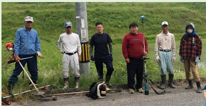
↑6月5日に、県道金田平和線(水越町堂迫)のアダプト活動を行いました。

●今年度も、通学する児童や地域の方が通行する際、きれいな環境で気持ちよく通行できるよう、これから、7月、8月、9月と年4回の草刈りを行う予定となっています。