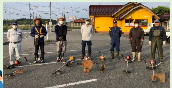
↑6月1日に、国道183号線尾引バス停から種森橋までの小学校通学路の歩道の草刈りを行いました。