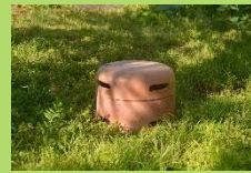
何になるのか楽しみです！！