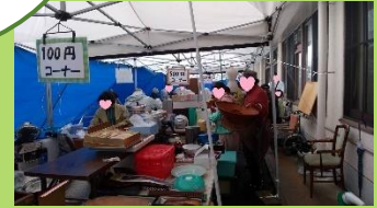
「これ懐かしい！」 「これ探してたんよ！！」