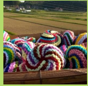
来られた方へと プレゼント頂きました。

山内リサイクルマーケット3R Reduce (ゴミの削減) Reuse (再利用) Recycle (再資源)