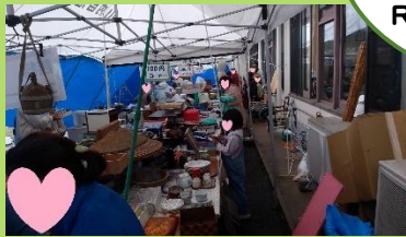
子どもさんから大人の方まで 大勢の方々が！！