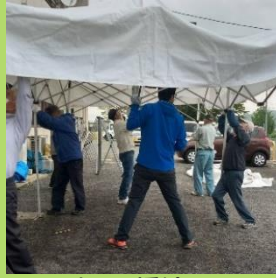
のべ59人で 橋渡しのご！ ありがとうございました。

今回は福祉協議会さんからもお声がけを頂き、火災で被害に遭われたお宅へ必要な物品を無償でお届けできました。また多くの皆様のご来場も頂き、5軒の空き家からの提供品は、ほぼ資源となりました。 売上金は空き家片付け終了後、処分費を除き、全額、山内小学校・保育所へ教育・保育支援金として寄付させていただきます。