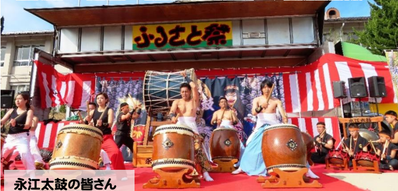
永江太鼓の皆さん

11月10日(日)午前9時から山内自治振興センターと山内小学校にて、恒例の山内ふさと祭りを開催しました。