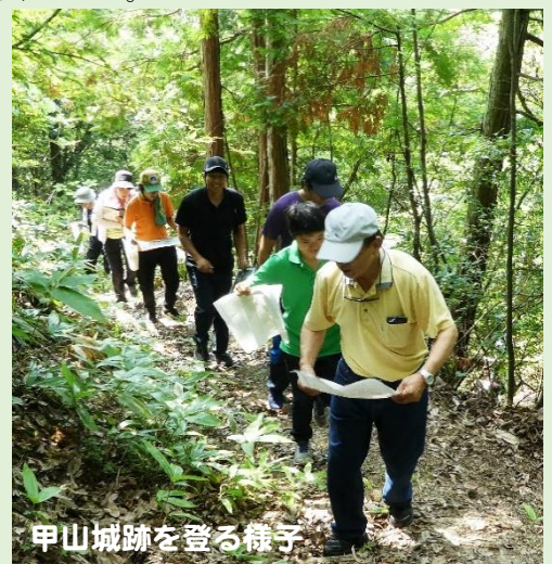
甲山城跡に登る様子

先生方は事前に山内の歴史についてよく調べておられ、質問も多く出され、とても意欲的に参加されました。そんな先生方を見ていると、郷土愛あふれる、たくましく将来性豊かな子どもたちを育ててくださると強く感じました。郷土史研究会もさらに小学校に協力をしていきたいと思っています。