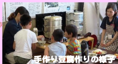
手作り豆腐作りの様子