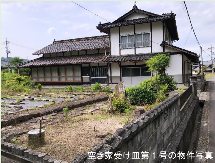
空き家受け皿第1号の物件写真

定住促進プロジェクト（空き家活用）対策として、各自治会長様から調査頂いた空き家調査票のデータに基づき、活動の出発点に立つことができました。