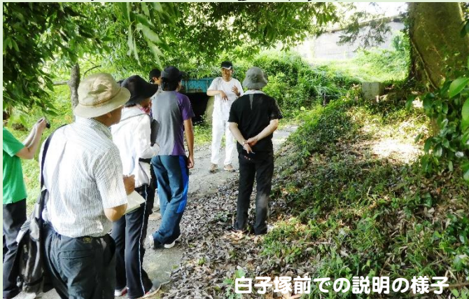
白子塚前での説明の様子

8月1日(木)に、郷土史研究会のメンバーが山内小学校の先生方に山内地区の重要文化財や史跡を説明しながらともに見て歩きました。