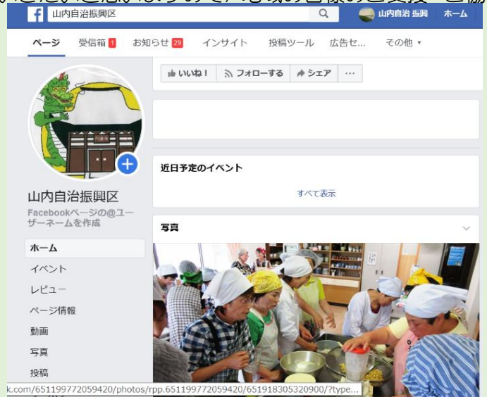
↑山内自治振興区のフェイスブック

『山内自治振興区』で検索お願いいたします。他の地域に住んでおられる家族の皆様、お知り合いの方々にもお知らせいただけたら幸いです。この小さな種まきが山内定住の花をも咲かせることを願いながら心を込めた温かい情報発信に努めていきたいと思っております。皆様からの情報提供もお待ちしております。