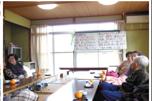
植物の名前の由来を勉強中