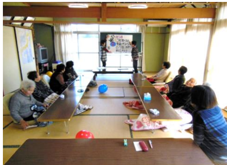
なぞなぞで頭の体操