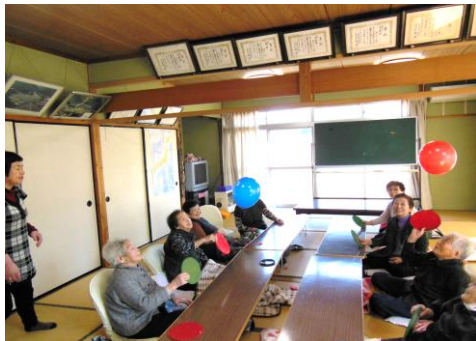
風船ゲームに挑戦中

今年度最後のデイホームもいつもどおり、体と頭の体操とゲームで大いに盛り上がった一日でした。次回の開催が6月と聞いて、「えー! しばらく会えん」とさみしそうでした。